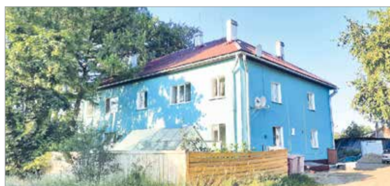
Вот так теперь выглядит дом на Профсоюзной улице