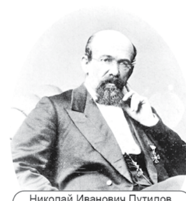
Николай Иванович Путилов, действительный статский советник, русский математик, инженер, предприниматель