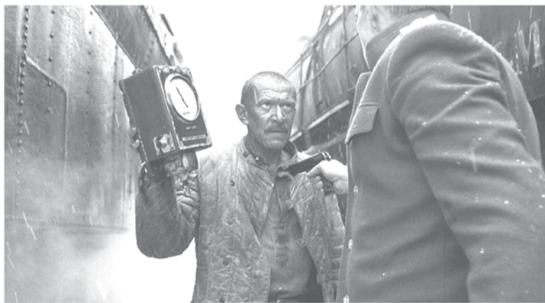
«Край» с Владимиром Машковым снимали в Ленобласти в 2008-2009 гг.

фестивале о том, что регион и дальше будет помогать кинематографистам по системе рибейтов – возмещения затрат на кинопроизводство. Как вы оцениваете такую практику?