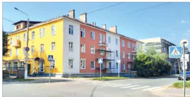
Такой фасад радует глаз (угол пр. Урицкого и ул. Титова)