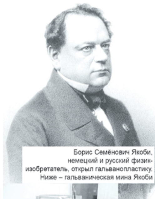
Борис Семёнович Якоби, немецкий и русский физик-изобретатель, открыл гальванопластику. Ниже – гальваническая мина Якоби

Именно понимание этого факта заставило правительство и, прежде всего, морское ведомство приступить к разработке нового оборонительного пояса в восточной части Балтики, чтобы полностью закрыть Финский залив для противников.