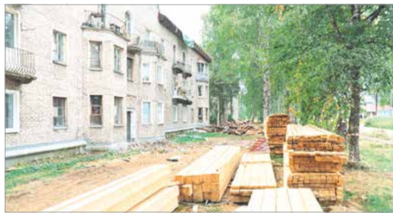
Подвезены материалы на ремонт дома на ул. Талалихина

Городским коммунальщикам надо бы тоже усилить свои функции по наведению порядка, в частности, в местах, где установлены контейнерные площадки для сбора бытовых отходов. Грустное зрелище в основном представляют и сами ёмкости, и дворы домов, которым «посчастливилось» быть по соседству: после освобождения контейнеров спецмашинами всё вокруг превращается в полигон мелкого мусора, полиэтиленовые пакеты – бич наших дворовых территорий.