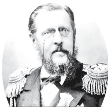
Великий князь Константин Николаевич, генерал-адмирал, младший брат императора Александра II