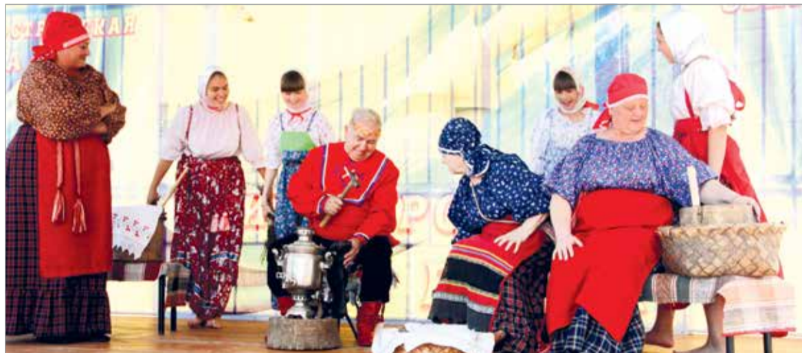
Коллектив «Оятская вечерка»