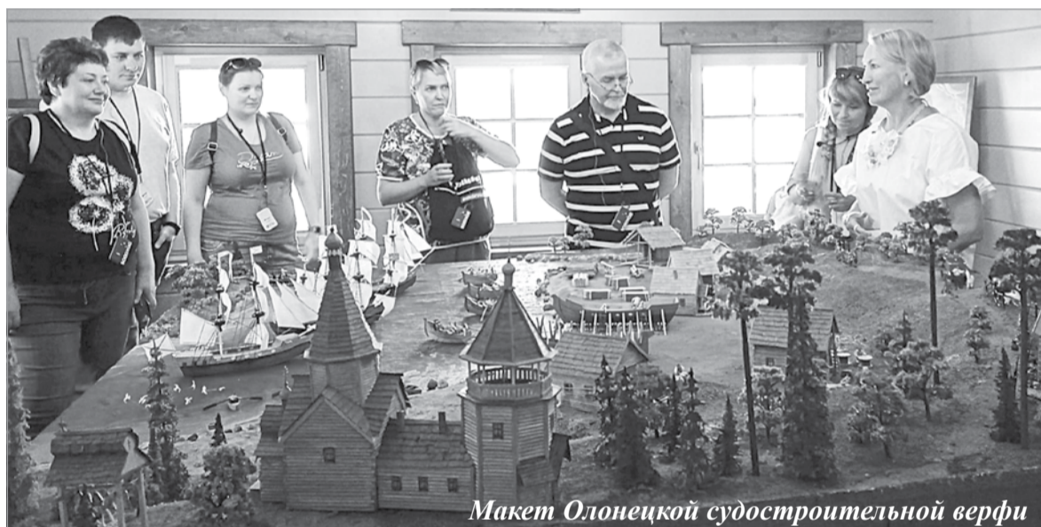
Макет Олонецкой судостроительной верфи

Старое Лодейное Поле в значительной мере сохранило свое лицо