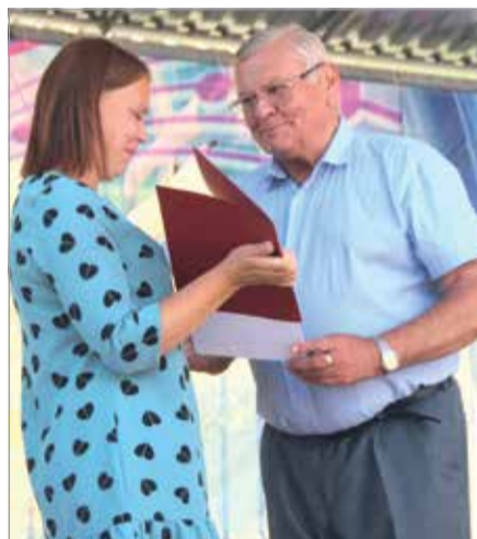
Поощрение за хорошую работу