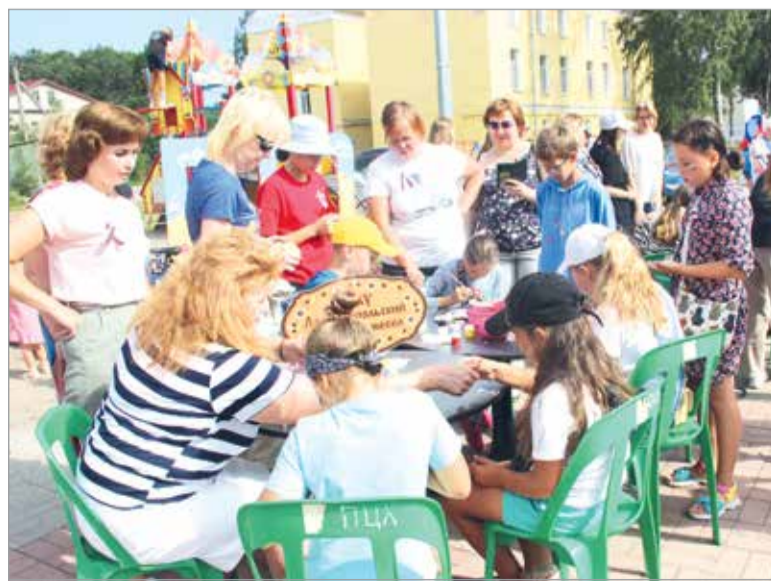
Мастер-класс по росписи «Я люблю тебя, Россия»