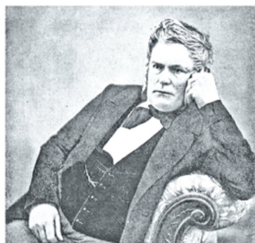
Эммануил Эммануилович Нобель, шведский и российский инженер, архитектор, изобретатель и промышленник, основатель промышленной династии Нобелей. Ниже – пиротехническая мина Нобеля

неврирования боевыми силами и средствами. Большое внимание уделялось их подвижности, а также вопросам маскировки (вплоть до посадки деревьев). Специально для пехоты проектировались отдельные убежища, а для скрытной переброски сил и средств на любой атакуемый участок сухопутного фронта – достаточное количество дорог (в том числе внутрифортная железная дорога, соединённая с гаванью и Финляндской железной дорогой). Были установле-