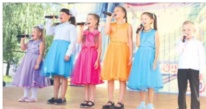
Вокальная студия «Мечта»