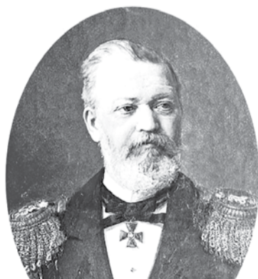
Иван Алексеевич Шестаков, адмирал, российский флотоводец и государственный деятель

Так или иначе, до серьёзной войны, подобной черноморской